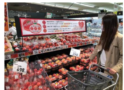
野菜・果物の機能性表示例